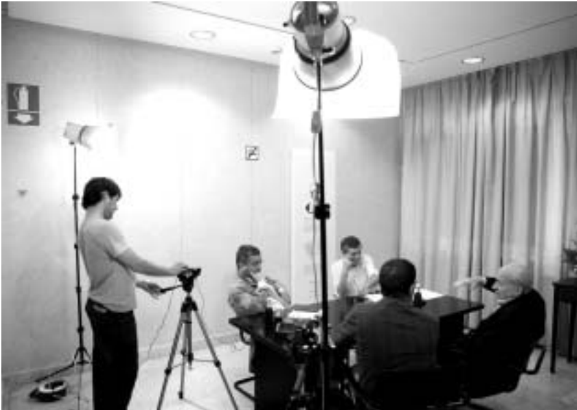
Bilboko Euskaltzaindiaren egoitzan egin genuen mahai-ingurua. Bideoan jaso eta sarean jarri dugu. www.argia.com/multimedia

pezetekin trukatu ditu, beraz eskertzekoa da bide berriak bilatzea. Euskal gehiengoaren sindikala –ELA buruan– prozesu oso interesgarria lantzen ari da, ELAk askoz gehiago egin dezakeen arren. Baldintzak daude aro berri batera joateko. Gakoa da gutxieneko puntu komunak lortzea: euskara, lurraldetasuna, kultura, hezkuntza, Nafarroa, Iparralde gaietan, hala etorkinen nola giza eskubideetan. Abertzaleek oso garbi izan behar ditugu horiek guztiak koiuntura politiko ezberdinen gainetik mantendu behar direla. Abertzaleek eusten badizkiote gutxieneko adostasun horiei, paisaia politikoa alda liteke.