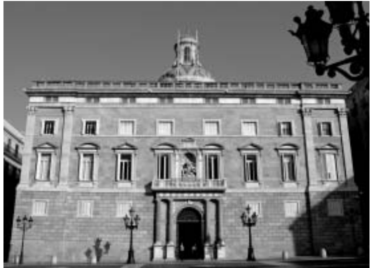
Kataluniako Genelaritateko Jauregia.

Lizarra-Garazitik Loiolara pasa gara, alderdi abertzale ezberdinen estrategia bateratu batetik, Ezker Abertzalea eta PSEren arteko bilkuretara. Estrategia paktistak nori mesede egiten dion asko eztabaidatua izan da. EAJk beti izan du horretarako abilezia Madrilekin eta alderdi interesak defendatzea egotzi zaio. Loiolako konbertsazioek ere bide beretsua izan dute, Espainiako Gobernua ETArekin eta Ezker Abertzalea PSErekin. Lehen itxura batean konbertsazio hauek eten dira eta argitara eman direnean errudun gisa EAJ aurkeztu dute. Gauzak okertu aurretik jeltzaleei deitu izanez gero gauzak bestelakoak izango lirakeela uste dute batzuek. Beste batzuek diote EAJk PSErekin bat egiteak bere benetako izaera, berriro ere, agerian