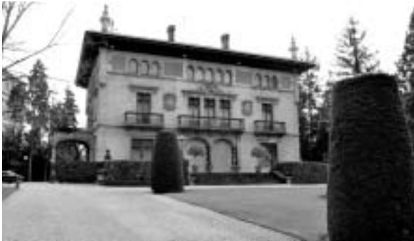
Ajuria Eneak lehendakari abertzale bati eman zion ostatu hogeita hamar urtez. Maizterrez aldatu da berriki.

betiko sukar eta oldarraz, gehiago ez diren posibilitate estrategikoez mintzatzen, aspalditik ahitu diren aukerak aipatzen, inguruan denaz ohartu gabe.